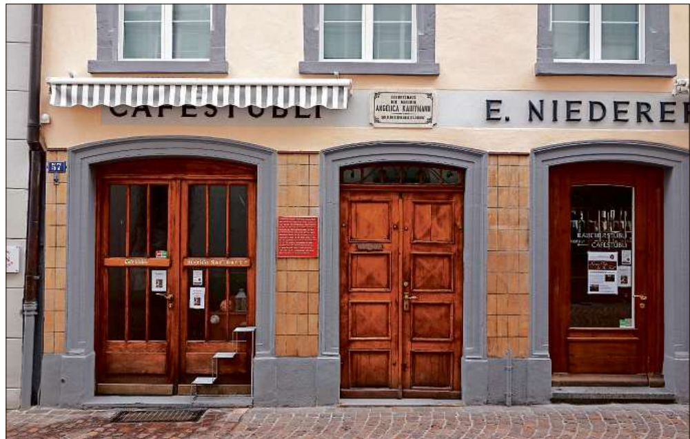
In diesem Haus an der Reichsgasse wurde Angelika Kauffmann geboren.