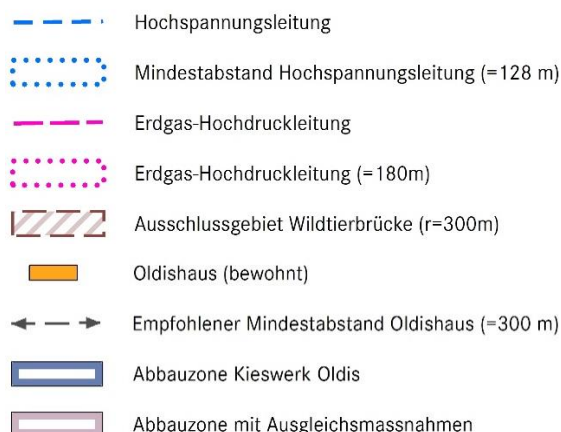
Abb. 1: Standort der geplanten Windenergieanlage Oldis II und zu berücksichtigende Abstände.