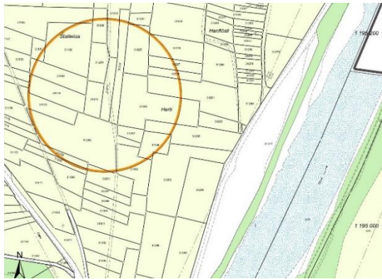
Festlegung neue Zone für Windenergieanlagen (Auszug Zonenplan und Genereller Gestaltungsplan 1:2'000).