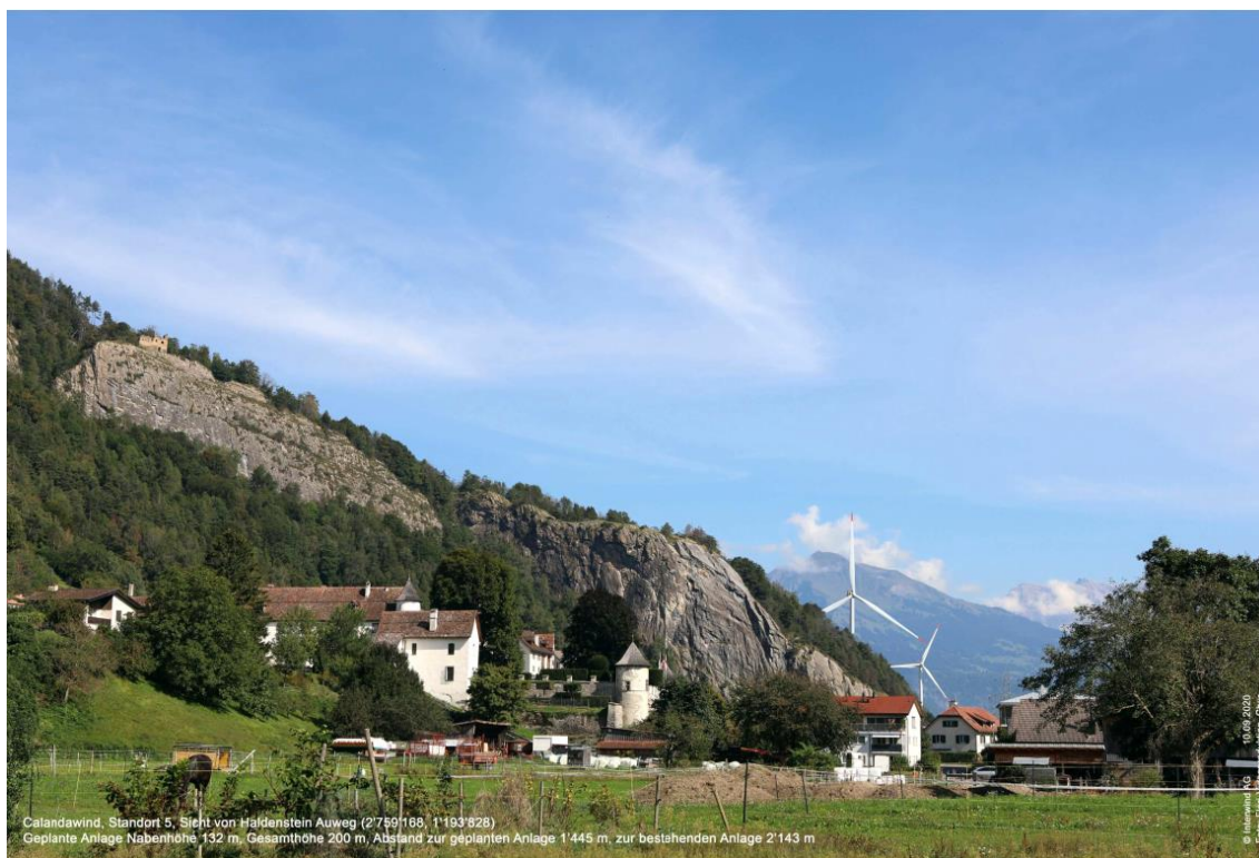
Calandawind, Standort 5, Sicht von Haldenstein Auweg (2759'188, 1193'828) Geplante Anlage Nabenhöhe 132 m, Gesamthöhe 200 m, Abstand zur geplanten Anlage 1'445 m, zur bestehenden Anlage 2'143 m

Visualisierung der geplanten Windenergieanlage Oldis II (Referenzanlage). Sicht von Haldenstein Auweg.