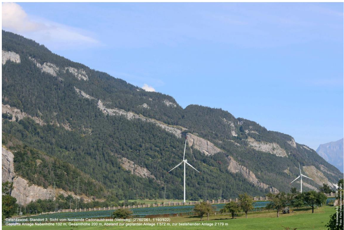
Visualisierung der geplanten Windenergieanlage Oldis II (Referenzanlage). Sicht vom Nordende der Cadonaustrasse.

Das Vorprojekt enthält verschiedene Visualisierungen der geplanten Windenergieanlage.