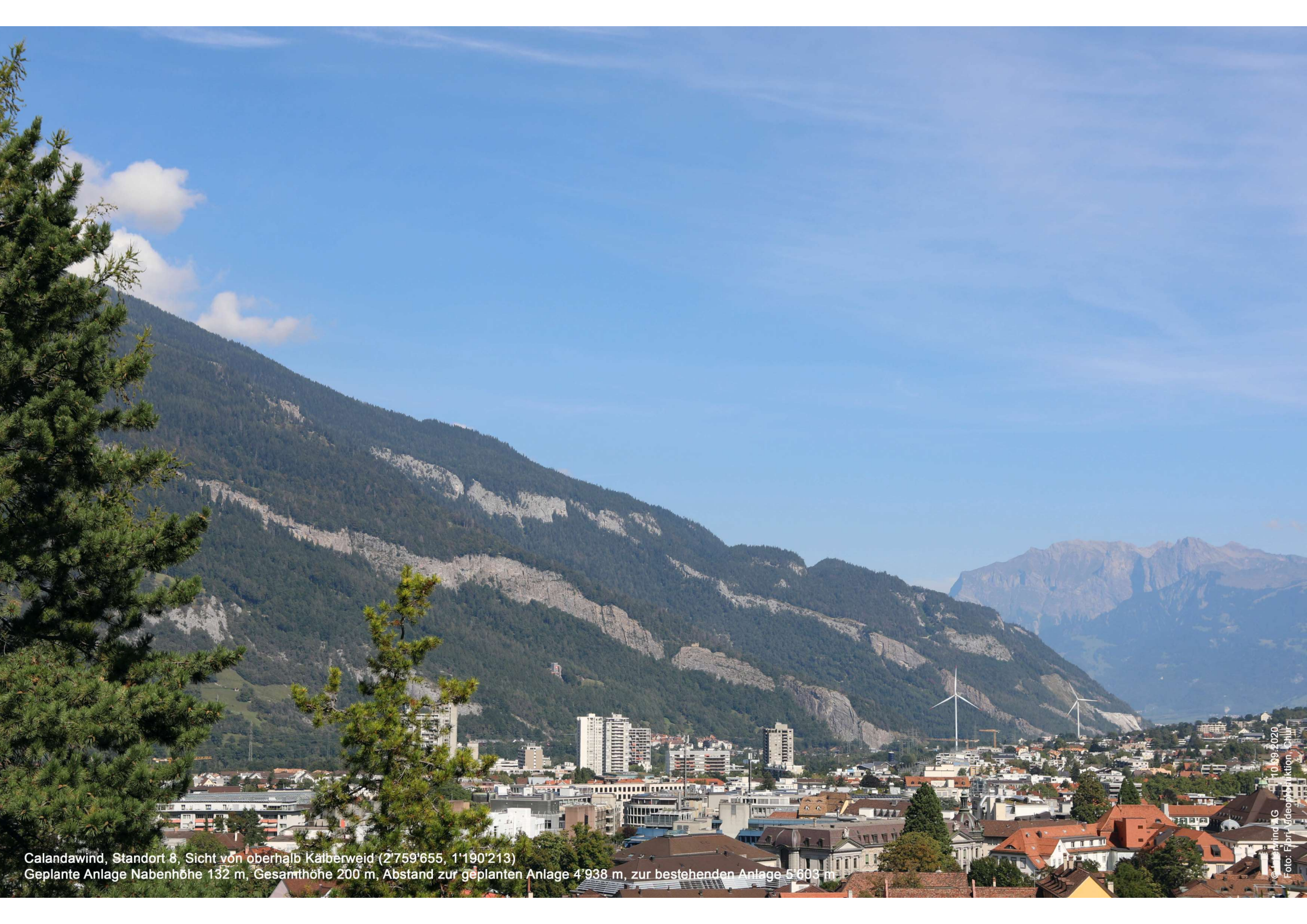
Calandawind, Standort 8, Sicht von oberhalb Käiberweid (2'759'655, 1'190'213) Geplante Anlage Nabenhöhe 132 m, Gesamthöhe 200 m, Abstand zur geplanten Anlage 4'938 m, zur bestehenden Anlage 5'603 m