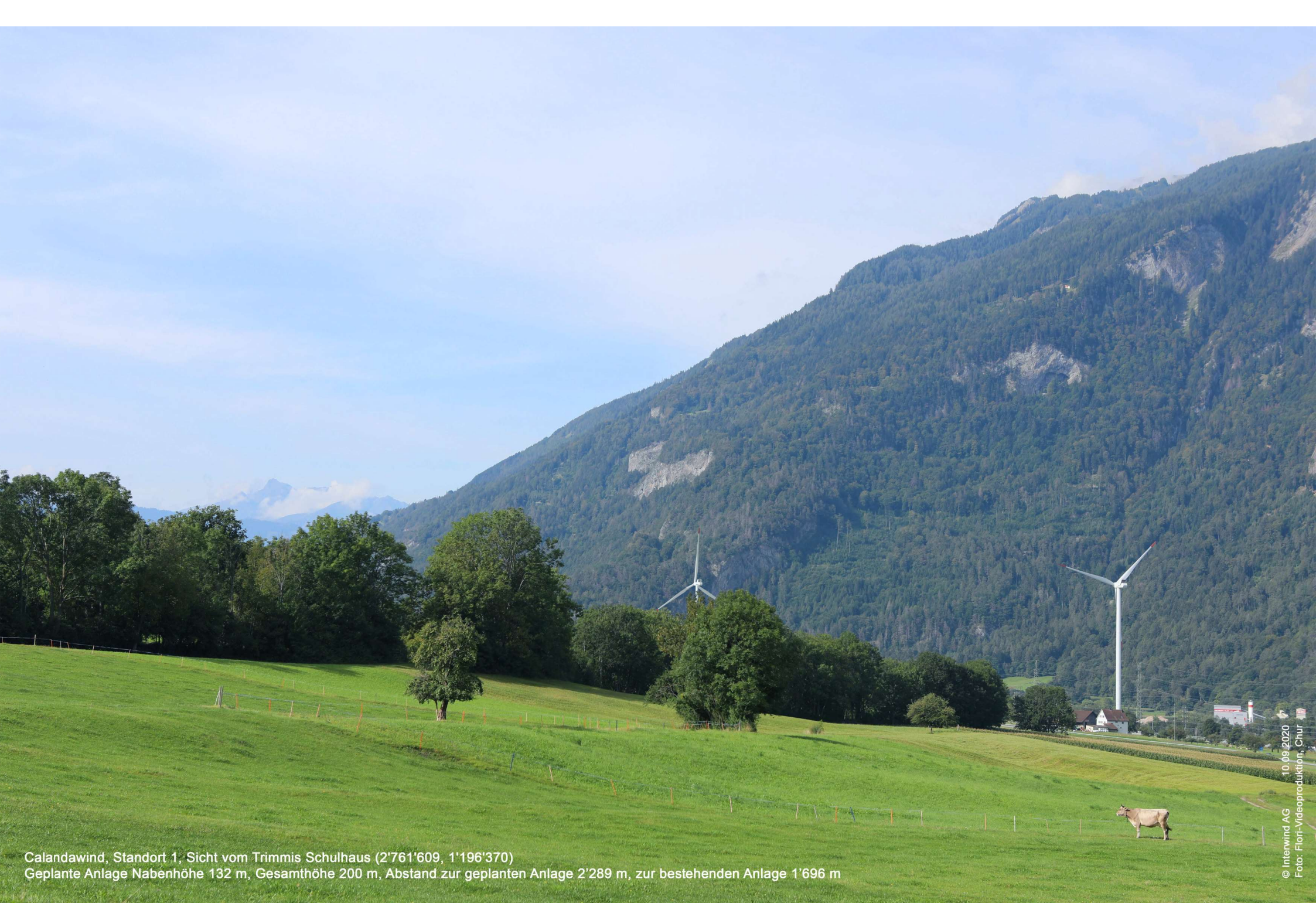
Calandawind, Standort 1, Sicht vom Trimmis Schulhaus (2'761'609, 1'196'370) Geplante Anlage Nabenhöhe 132 m, Gesamthöhe 200 m, Abstand zur geplanten Anlage 2'289 m, zur bestehenden Anlage 1'696 m