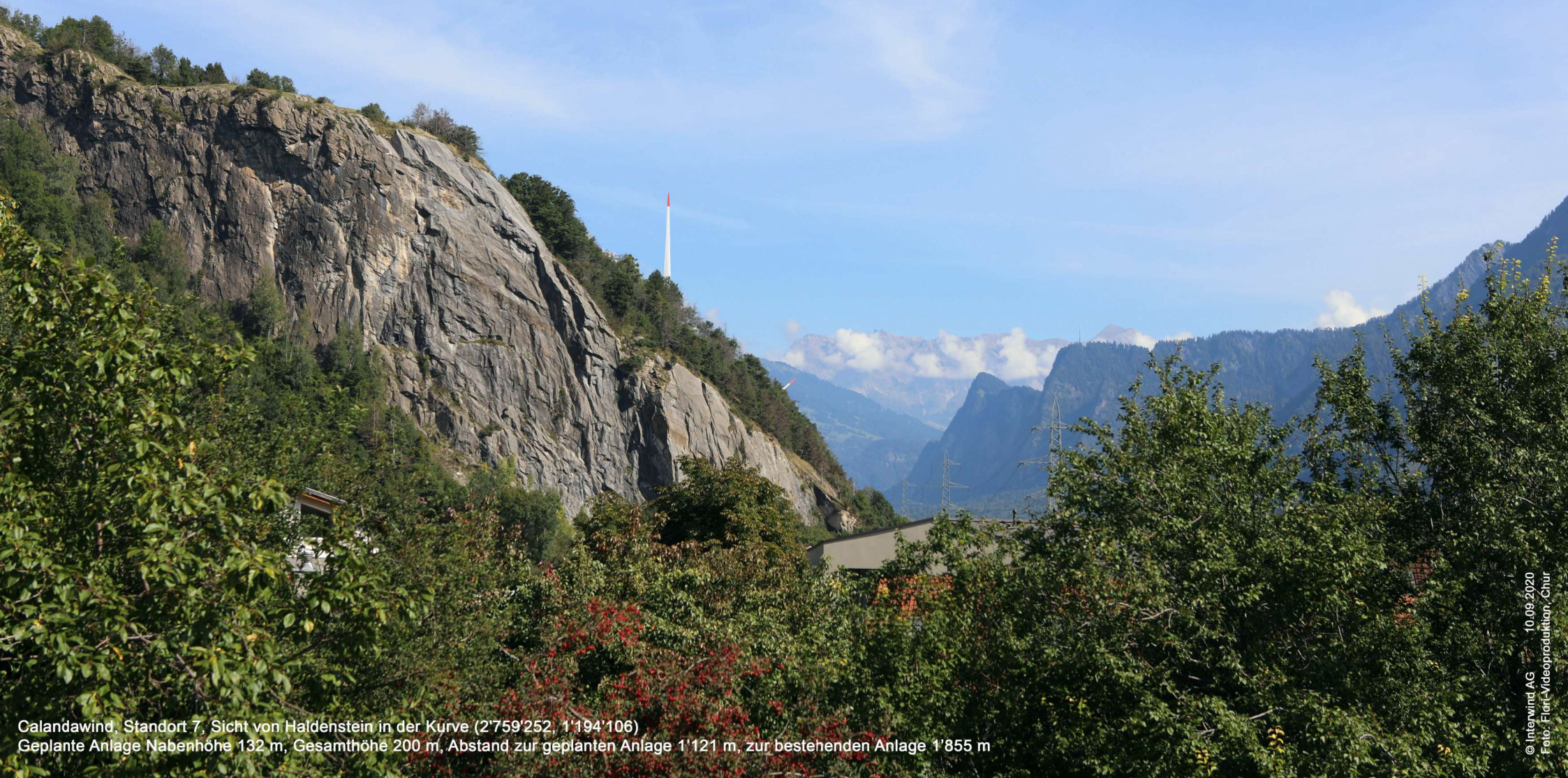
Calandawind, Standort 7, Sicht von Haldenstein in der Kurve (2'759'252, 1'194'106) Geplante Anlage Nabenhöhe 132 m, Gesamthöhe 200 m, Abstand zur geplanten Anlage 1'121 m, zur bestehenden Anlage 1'855 m