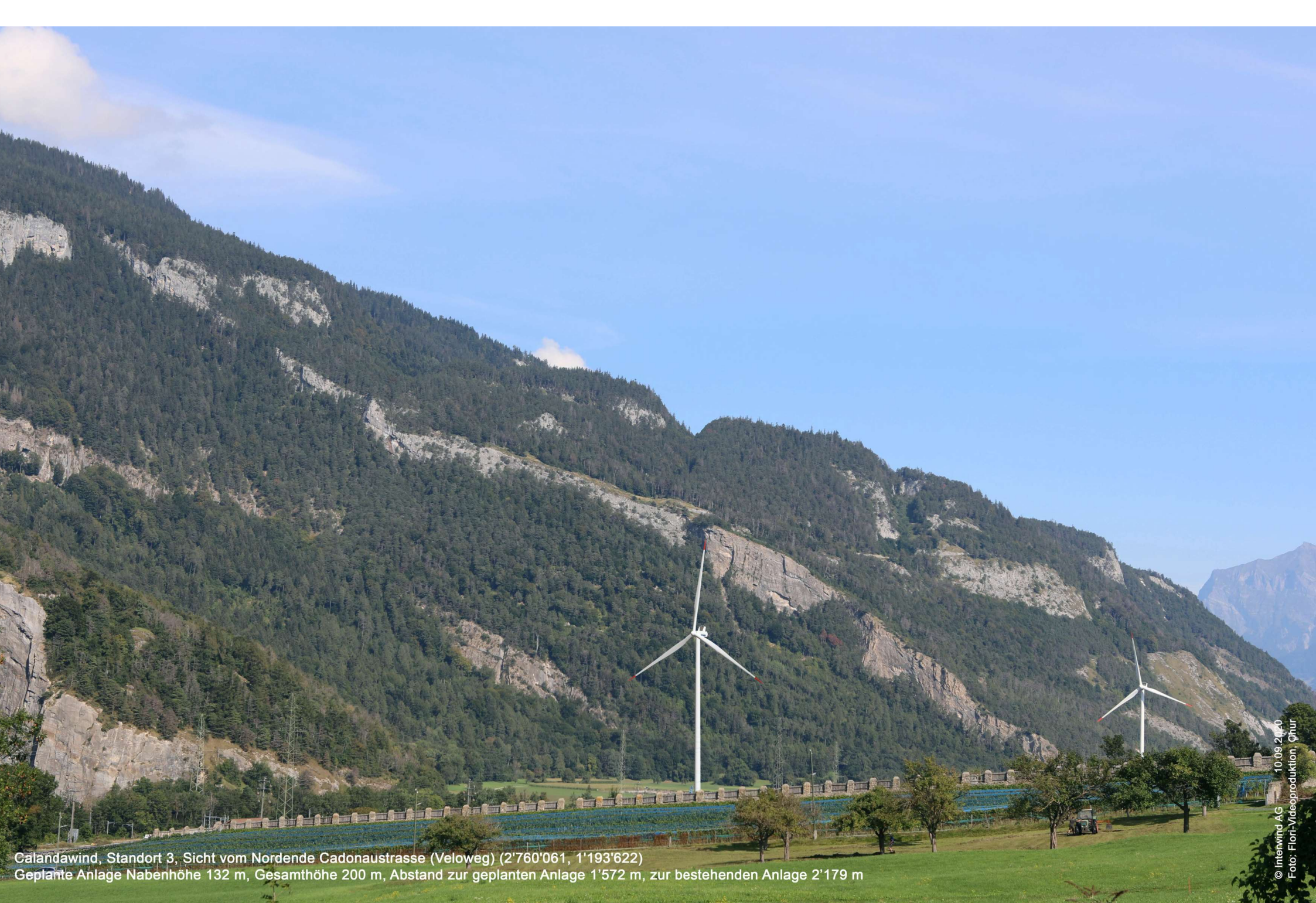
Calandawind, Standort 3, Sicht vom Nordende Cadonastrasse (Veloweg) (2'760'061, 1'193'622) Geplante Anlage Nabenhöhe 132 m, Gesamthöhe 200 m, Abstand zur geplanten Anlage 1'572 m, zur bestehenden Anlage 2'179 m