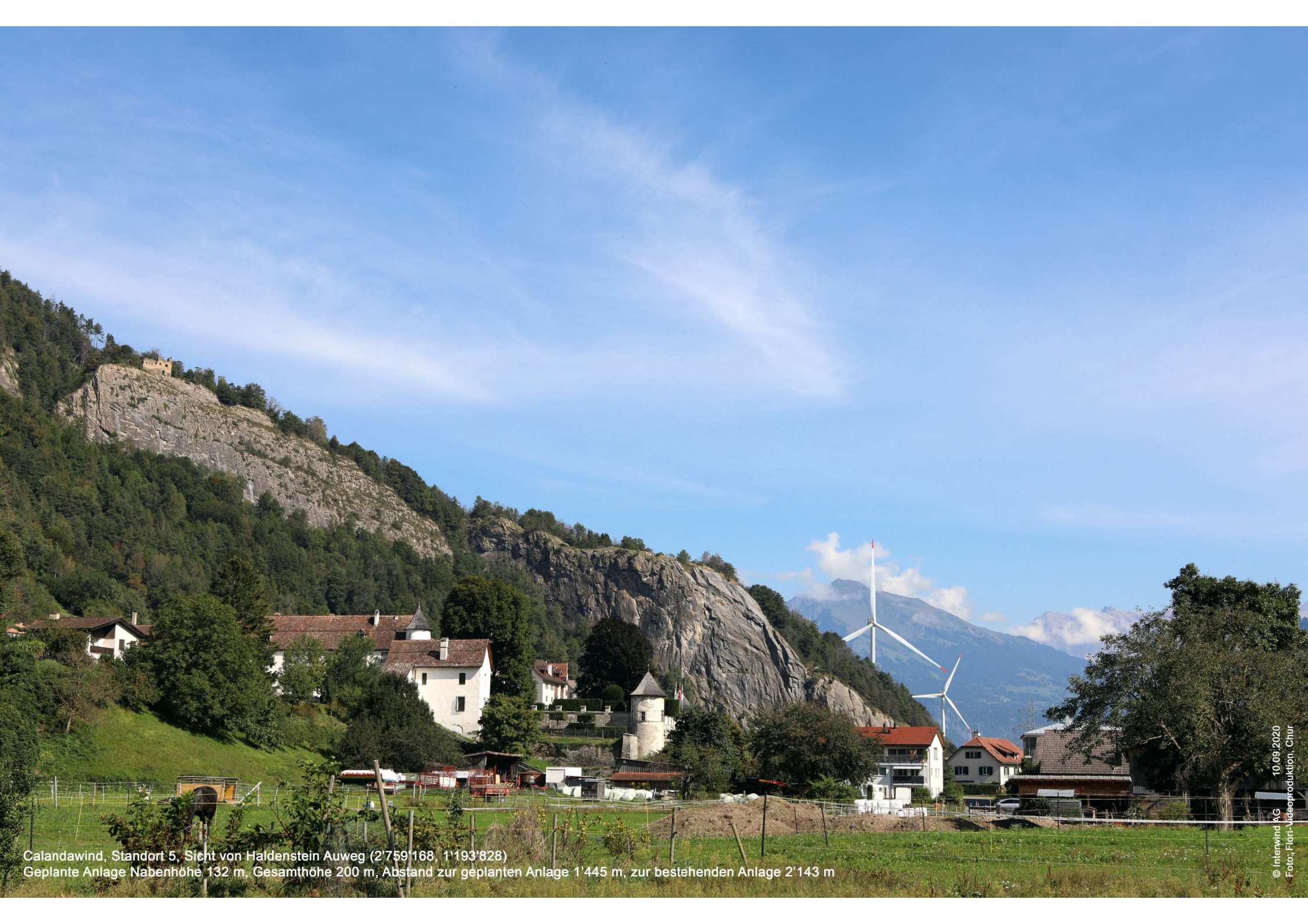
Calandawind, Standort 5, Sicht von Haldenstein Auweg (2'759'168, 1'193'828) Geplante Anlage Nabenhöhe 132 m, Gesamthöhe 200 m, Abstand zur geplanten Anlage 1'445 m, zur bestehenden Anlage 2'143 m