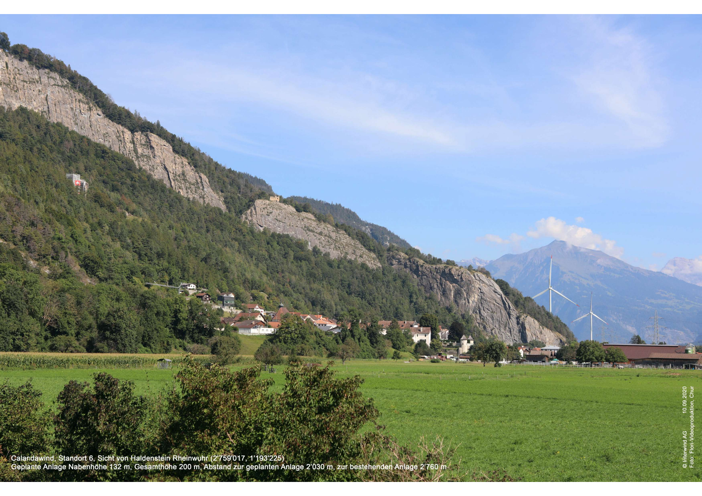
Calandawind, Standort 6, Sicht von Haldenstein Rheinwuh (2'759'017, 1'193'225) Geplante Anlage Nabenhöhe 132 m, Gesamthöhe 200 m, Abstand zur geplanten Anlage 2'030 m, zur bestehenden Anlage 2'760 m