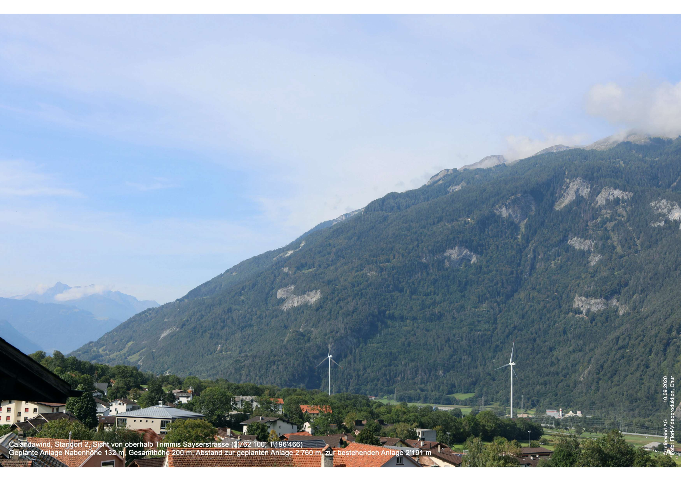
Calandawind, Standort 2, Sicht von oberhalb Trimmis Sayerstrasse (2'762'100, 1'196'466) Geplante Anlage Nabenhöhe 132 m, Gesamthöhe 200 m, Abstand zur geplanten Anlage 2'760 m, zur bestehenden Anlage 2'191 m